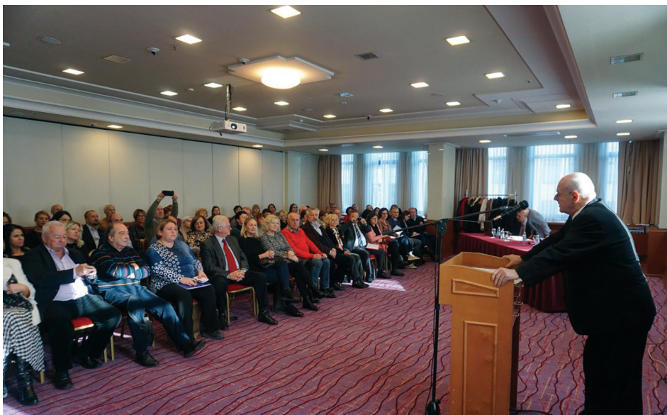
Edukacija je uvjet boljeg rada vijeća i predstavnika

Rezultati izbora postaju konačni istekom rokova za zaštitu izbornog prava, odnosno danom donošenja odluke Ustavnog suda Republike Hrvatske povodom žalbe podnesene u postupku zaštite izbornog prava.