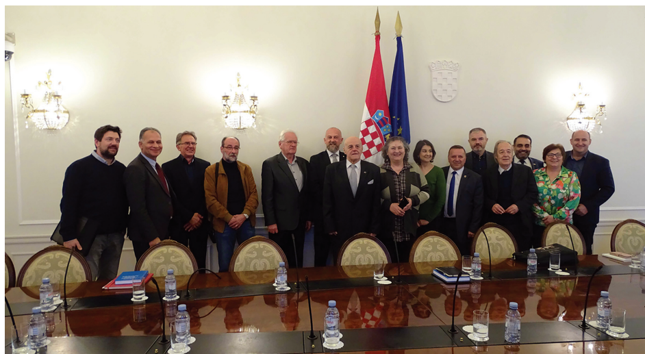
Savjet za nacionalne manjine

Istovremeno je i sam Savjet za nacionalne manjine kao krovna manjinska institucija u Republici Hrvatskoj, dobio mogućnost da dalje jača svoju poziciju i ulogu u kreiranju manjinske politike. Aktivnosti iz Operativnih programa kojima je Savjet (su)nositelj u najvećem se dijelu odnose na ostvarivanje kulturne