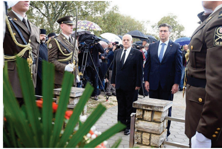
Manjine uz podršku Vlade očekuju daljnji napredak u zaštiti svojih prava

Sigurno je da će do određenih redukcija doći. To je jednostavno u ovoj teškoj situaciji nemoguće izbjeći. To će pogoditi čitavo društvo i sve njegove segmente i nacionalne manjine tu ne mogu biti izuzetak. Mi smo utvrdili, da tako kažem, teorijski plan raspodjele svih sredstava koja su nam odobrena za programe kulturne autonomije, ali kako će ići praktična realizacija to tek ostaje da se vidi. Naravno, nadamo se i dalje određenom razumijevanju Vlade pa i određenoj pozitivnoj diskriminaciji, kako neki vrlo osjetljivi segmenti kulturne autonomije nacionalnih manjina ne bi bili osjetno