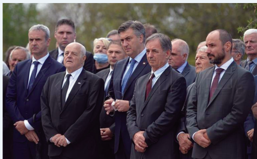
Komemoracija u Varivodama: početak procesa pomirenja kao jedan od prvih rezultata koalicijske vlade premijera Andreja Plenkovića i zastupnika nacionalnih manjina

Naravno da su organizacije, institucije, udruge nacionalnih manjina, svi subjekti manjinske politike pogođeni ovom situacijom kao i svi drugi segmenti društvenog života. Nisu tu manjine nikakav izuzetak. Ali isto tako, treba odmah reći da su se i svi subjekti manjinske politike, počevši od udruga i društava, saborskih zastupnika nacionalnih manjina, članova Savjeta i drugih koji djeluju u okviru manjinskih politika u našem društvu, odmah maksimalno angažirali i mobilizirali da, koliko je to god moguće, ublažimo ovo stanje i njegove negativne posljedice. Jasno je da su pojedine aktivnosti i programi nacionalnih manjina (ili barem njihovi dijelovi) kao što su manifestacije, javno djelovanje kulturnih, folklornih društava itd. bili reducirani, ogođeni ili otkazani, ali i