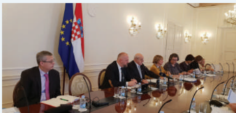
Savjet za nacionalne manjine ponovno je upozorio na porast atmosfere nesnošljivosti i etnocentrizma

Dosada su vijeća i predstavnici birani temeljem Zakona o lokalnoj i regionalnoj samoupravi, što nije korespondiralo s Ustavnim zakonom o pravima nacionalnih manjina. Donošenjem ovog novog zakona prvi put su jedinstveno utvrđena pitanja održavanja odnosno organizacije izbora, izborne promidžbe, naknade troškova itd., oko kojih pitanja je prilikom dosadašnjih izbora bilo je puno problema. Cilj je bio ovim zakonom osigurati preduvjete za kvalitetnije sudjelovanje nacionalnih manjina u javnim poslovima lokalne i regionalne samouprave putem vijeća i predstavnika te da imaju mogućnost aktivnijeg participiranja u razvoju općina, gradova i županija u kojima žive.