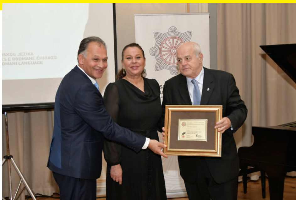
Zahvalnica udruge "Kali Sara" povodom Dana romskog jezika

■ Kada se spominje protumanjinska retorika, treba istaći da je Savjet nedavno ponovno objavio priopćenje u kojem upozorava na porast atmosfere etničke nesnošljivosti i etnocentrizma u hrvatskom društvu. U priopćenju se poziva na faktički istoimenu Deklaraciju u kojoj ste upozorili na te probleme još 2015. godine. I vi ste u vašim javnim istupima više puta upozoravali da posljednjih godina imamo sve izraženije retrogradne pojave kada je u pitanju etnička tolerancija i odnos prema nacionalnim manjinama (a u posljednje vrijeme i sve otvorenije i opasnije incidente). Što se zbiva u hrvatskom društvu posljednjih godina kada je u pitanju etnička tolerancija i odnos prema nacionalnim manjinama?