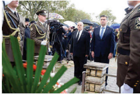
Manjine uz podršku Vlade očekuju daljnji napredak u zaštiti svojih prava

Sigurno je da će do određenih redukcija doći. To je jednostavno u ovoj teškoj situaciji nemoguće izbjeći. To će pogoditi čitavo društvo i sve njegove segmente i nacionalne manjine tu ne mogu biti izuzetak. Mi smo utvrdili, da tako kažem, teorijski plan raspodjele svih sredstava koja su nam odobrena za programe kulturne autonomije, ali kako će ići praktična realizacija to tek ostaje da se vidi. Naravno, nadamo se i dalje određenom razumijevanju Vlade pa i određenoj pozitivnoj diskriminaciji, kako neki vrlo osjetljivi segmenti kulturne autonomije nacionalnih manjina ne bi bili osjetno