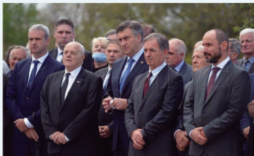
Komemoracija u Varivodama: početak procesa pomirenja kao jedan od prvih rezultata koalicijske vlade premijera Andreja Plenkovića i zastupnika nacionalnih manjina

Naravno da su organizacije, institucije, udruge nacionalnih manjina, svi subjekti manjinske politike pogođeni ovom situacijom kao i svi drugi segmenti društvenog života. Nisu tu manjine nikakav izuzetak. Ali isto tako, treba odmah reći da su se i svi subjekti manjinske politike, počevši od udruga i društava, saborskih zastupnika nacionalnih manjina, članova Savjeta i drugih koji djeluju u okviru manjinskih politika u našem društvu, odmah maksimalno angažirali i mobilizirali da, koliko je to god moguće, ublažimo ovo stanje i njegove negativne posljedice. Jasno je da su pojedine aktivnosti i programi nacionalnih manjina (ili barem njihovi dijelovi) kao što su manifestacije, javno djelovanje kulturnih, folklornih društava itd. bili reducirani, ogođeni ili otkazani, ali i