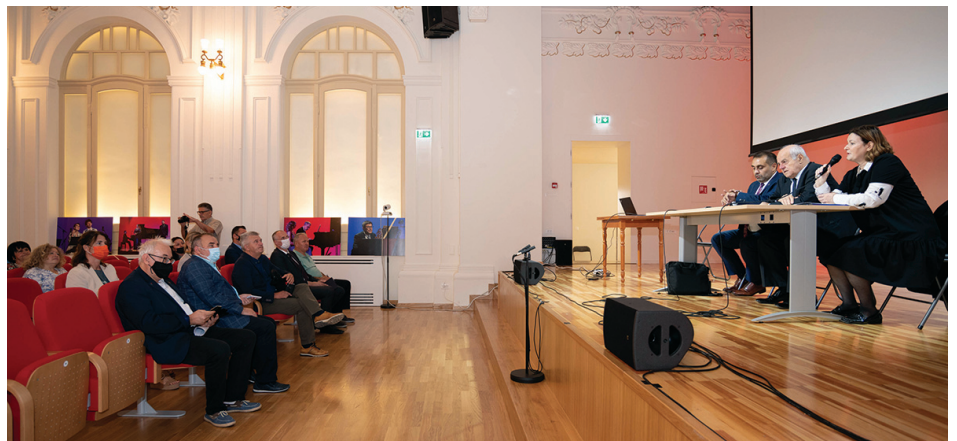
Edukacija je stalni imperativ za bolje funkcioniranje manjinske politike

Svi smo uložili ogromni napor da se svi mogu slobodno izjasniti o svojoj nacionalnoj pripadnosti i da se suprostavimo negativnom utjecaju još uvijek prisutnih postkonfliktnih odnosa na pojedinim područjima, prisutnoj