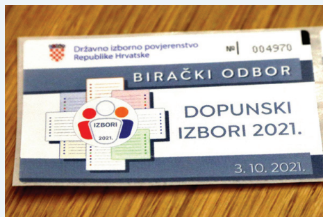
Nova izborna pravila u funkciji jačanja legitimiteta manjinskih predstavnika

Savjet sustavno prati realizaciju Operativnih programa Vlade RH za nacionalne manjine i mislim da, realno gledajući možemo, ako hoćete, biti prilično optimistični i relativno zadovoljni dosadašnjom dinamikom ostvarivanja u okolnostima u kojima jesmo, a u kojima se mnogo toga ipak teže ostvaruje. Međutim, Operativni programi napreduju, možda ne sa 100-postotnim ostvarenjem kao što bi željeli, ali još uvijek tempom i obimom s kojim za sada možemo biti zadovoljni. Ono što jeste bitno je činjenica da realizaciju ovih Operativnih programa prati jedna razrađena metodologija analize njihove učinkovitosti i realizacije, počevši od Vlade i njenih ministarstava pa dalje. To omogućava da u svakom momentu vidimo i realne