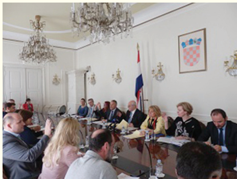
Savjet za nacionalne manjine od Vlade uskoro očekuje novi zakon za predstojeće izbore manjinske samouprave

Na početku treba reći i istaknuti, po tko zna koji put, da manjinska prava čine osnovu društvenog suživota. Ona su u svakom demokratskom društvu i u Europi i u svijetu temelj pravednosti, sigurnosti i mira u tim društvenim sredinama. Nažalost, treba podsjetiti da su nakon ulaska Hrvatske u EU neke političke grupacije, koje su nominalno vezane za civilno društvo, krenule u agresivnu i kontinuiranu akciju pokušaja smanjivanja dosegnutih prava nacionalnih manjina, posebno njihovog zastupanja u političkom životu. To traje već dugo i nastavlja se s više ili manje intenziteta. A, da li može dosegnuti stupanj manjinskih prava krenuti u suprotnom smjeru, da li se može otvoriti jedan ireverzibilni proces kada su u pitanju manjinska prava u političkom životu i uopće njihovo sudjelovanje u javnom životu to je za svako društvo, a naše pogotovo, izrazito osjetljivo i opasno pitanje. S obzirom na sva iskustva, ratna, poratna, u nekim aspektima i svakodnevna iskustva, posebno ona s kojima se danas suočavamo na širem, svjetskom, globalnom planu kao što je primjerice prognanička kriza, koja u fokus opet stavlja određene manjinske skupine, mi moramo biti svjesni da bi restriktivno zadiranje u manjinska prava imalo više nego negativne i devastirajuće posljedice na čitavo naše društvo. Uz to i posebno negativne refleksije na međunarodnom planu kada je naša zemlja u pitanju.