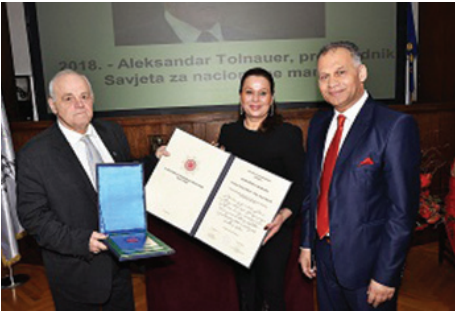
Nagrada romske udruge "Kali Sara"

■ Koji su uzroci tih pokušaja da se ograniče prava nacionalnih manjina (izbor zastupnika, uporaba jezika i pisma, medijski prava itd.) i koje su moguće posljedice takvih orijentacija za demokratski poredak, duh tolerancije i usvajanje europskih vrijednosti i načela u hrvatskom društvenom i političkom životu?